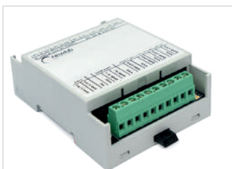
DMX-CV-HP (L406MA0GT4A04) DMX-CC-HP (L405MA0GC4A04)