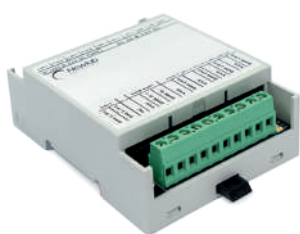
DMX-4CV (L406MA0GT4A01) DMX-4CC (L405MA0GC4A01)