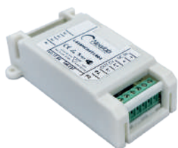
DALI-CV (L400MA04T1A01) DALI-CC (L400MB04C1A01)