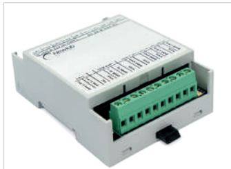
DALI-CV-HP (L406MA0GT4A04) DALI-CC-HP (L405MA0GC4A04)