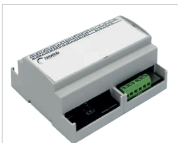
DALI-230V-500W (L642MA03T1A01) DALI-230V-1KW (L642MB03T1A01)